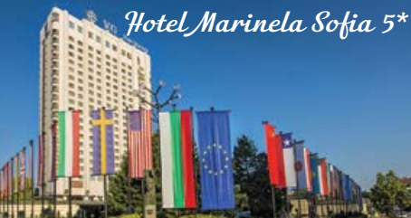
Hotel Marinela Sofia 5*

Το Hotel Marilena απέχει μόλις 20 λεπτά οδικώς από το αεροδρόμιο της Σόφιας, το πρόσφατα ανακαινισμένο Hotel Marinela Sofia προσφέρει εσωτερική πισίνα, 6 εστιατόρια, 4 μπαρ, γυμναστήριο και όμορφη θέα στην πόλη και στο βουνό.