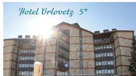
Hotel Orlovetz 5*

Το Hotel Perelik βρίσκεται σε κεντρική τοποθεσία, στην καρδιά του Παμπόροβο. Προσφέρει άρτια εξοπλισμένα καταλύματα που ανακαινίστηκαν πρόσφατα και πολλές επιλογές για φαγητό.