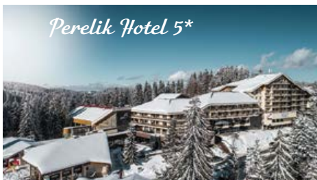
Perelik Hotel 5*

Πρωινό. Ελεύθερος χρόνος για μία τελευταία βόλτα. Έπειτα συγκέντρωση και ξεκινάμε το ταξίδι της επιστροφής.