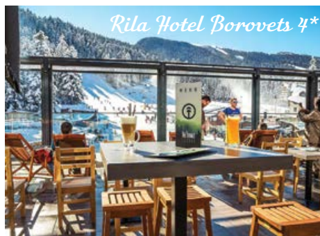
Rila Hotel Borovets 4*